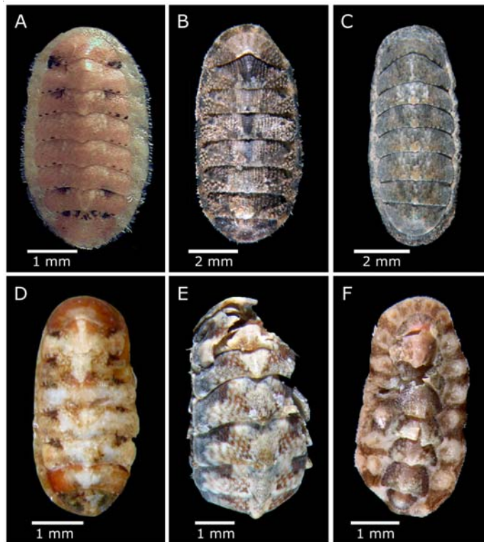
Figura 2. Especies de polioplacóforos recolectadas en Montepío, Veracruz, sur del Golfo de México. A. Lepidochitona rosea , B. Chaetopleura apiculata , C. Ischnochiton kaasi , D. Lepidochitona liozonis , E. Lepidochitona pseudoliozonis , F. Acanthochitona andersoni / Polyplacophoran species collected in Montepío, Veracruz, southern Gulf of Mexico

Durante la época de secas, los individuos se encontraron generalmente sobre el sustrato, en tanto que durante la época de nortes, los quitones estaban más al abrigo de las inclemencias ambientales. Lepidochitona pseudoliozonis y L. liozonis se encontraron sobre tapetes algales; esta última especie, sobre colonias de algas incrustantes de tonos marrón-rojizas. Lepidochitona rosea se encontró sobre las rocas, en ocasiones formando