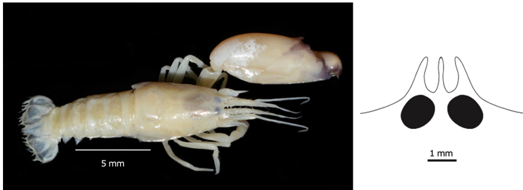
Figura 2. Synalpheus herricki . Macho colectado dentro de la esponja Aiolochoira crassa en el Parque Nacional Arrecife Puerto Morelos, México / Male collected inside the sponge Aiolochoira crassa in the Parque Nacional Arrecife Puerto Morelos, Mexico