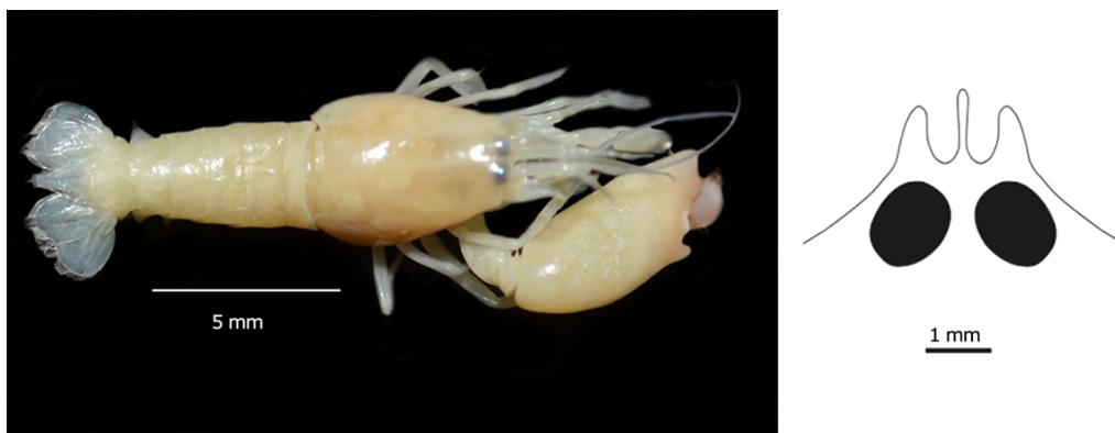
Figura 3. Synalpheus pandionis . Macho colectado dentro de la esponja Aiolochoira crassa en el Parque Nacional Arrecife Puerto Morelos, México / Male collected inside the sponge Aiolochoira crassa in the Parque Nacional Arrecife Puerto Morelos, Mexico